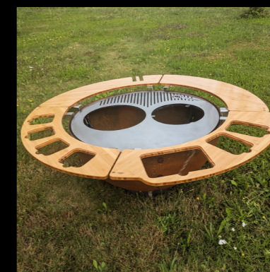
4 x TISCHMODUL FREI WÄHLBAR

Seitenbrett mit Aussparungen für 2 x 1000 ml und 1 x 3000 ml IKEA 365+ Behälter*.