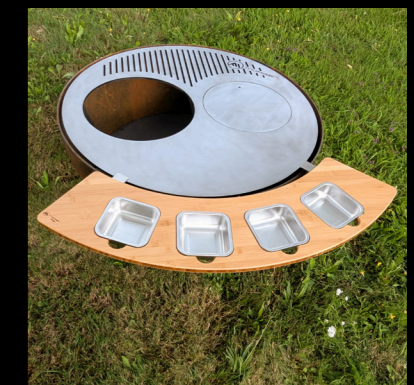
TISCHMODUL MIT BEHÄLTER (KLEIN)

Seitenbrett mit Halter für ein Handtuch oder Grillwerkzeug.