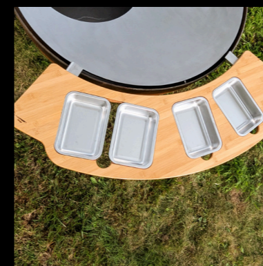
TISCHMODUL MIT BEHÄLTER (GROSS)

Seitenbrett mit Aussparungen für 4 x 600 ml IKEA 365+ Behälter*.