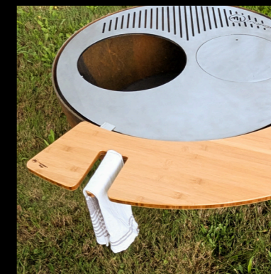
TISCHMODUL MIT HALTER

Seitenbrett mit Halter für ein Handtuch oder Grillwerkzeug.